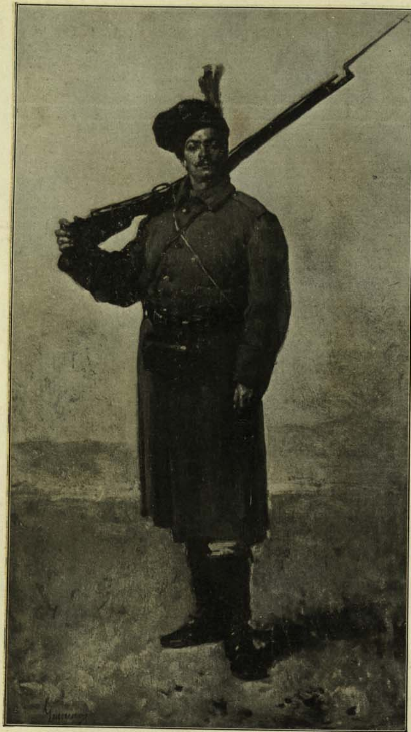
..... ..... N. GRIGORESCU: SENTINELĂ. .... .....