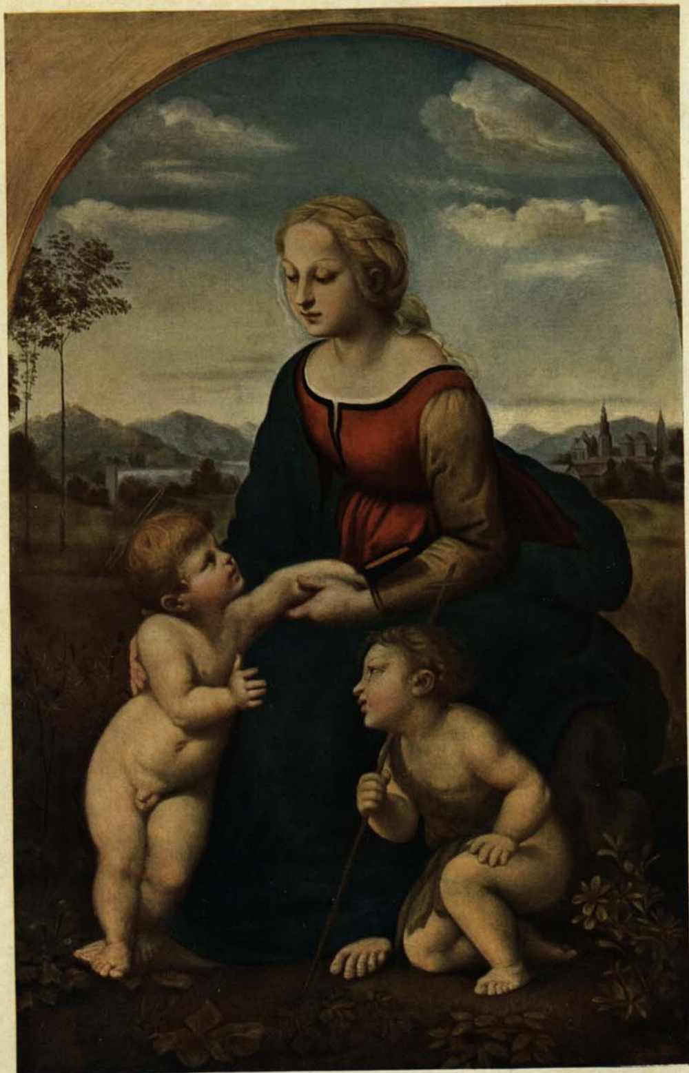
Raffael: Frumoasa grădinareasă